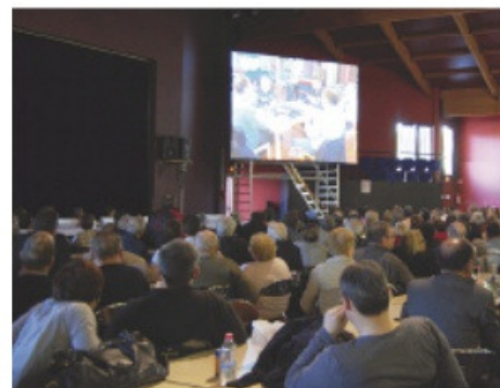
Finale en direct pour le plaisir de 620 joueurs