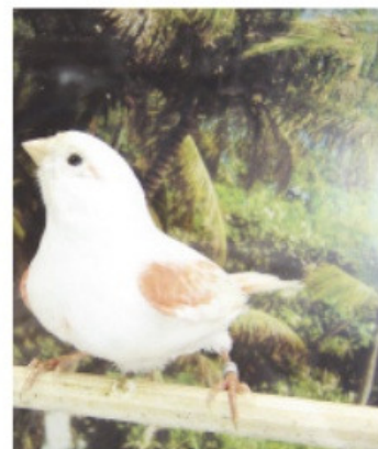
Une femelle rouge mosaïque