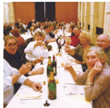
Convivialité et joie d'être ensemble ont encore été de mise lors du banquet de clôture

Tout s'est terminé par la lecture du palmarès, la remise des trophées et le banquet qui a permis de se détendre en se disant à très bientôt. C'est sûr, on reviendra !