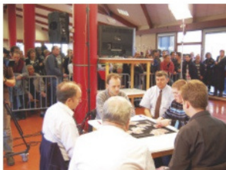
Les 4 finalistes et les 2 arbitres en live !

La finale devant les caméras a de quoi impressionner ! Ils représentent leurs régions, leurs clubs et portent les espoirs des dirigeants de leurs comités.